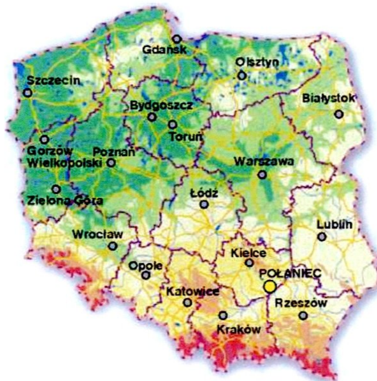
Rysunek 1. Lokalizacja Gminy Połaniec w Polsce

W skład miasta i gminy wchodzi: miasto Połaniec i 17 wsi sołeckich: Brzozowa, Kamieniec, Kraśnik, Łęg-Zawada, Maśnik, Okragła - Luszyca, Rudniki, Ruszcza, Ruszcza Kępa, Rybitwy, Tursko Małe, Tursko Małe Kolonia, Winnica, Wymysłów, Zdzieci Nowe, Zdzieci Stare, Zrębin.