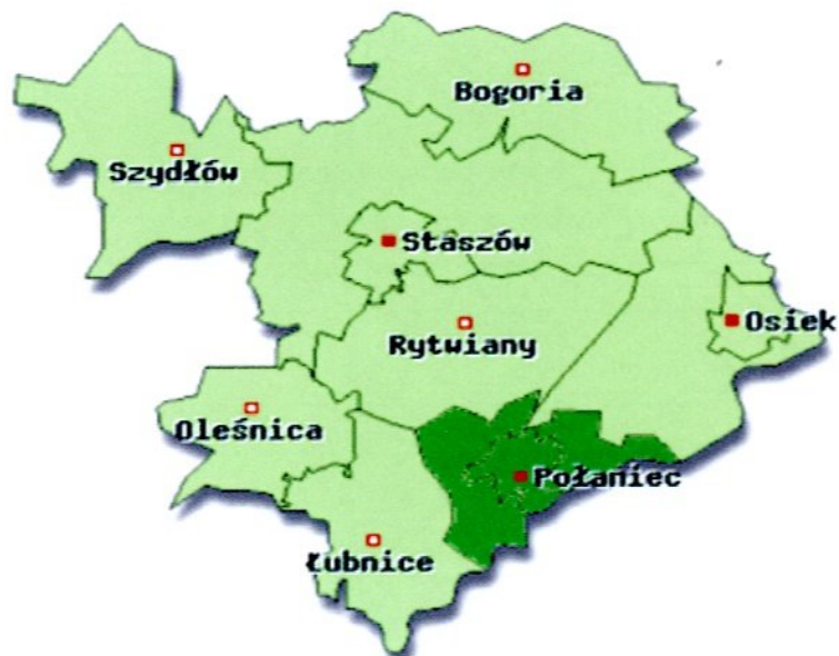
Rysunek 3. Lokalizacja Gminy Połaniec w Powiecie Staszowskim