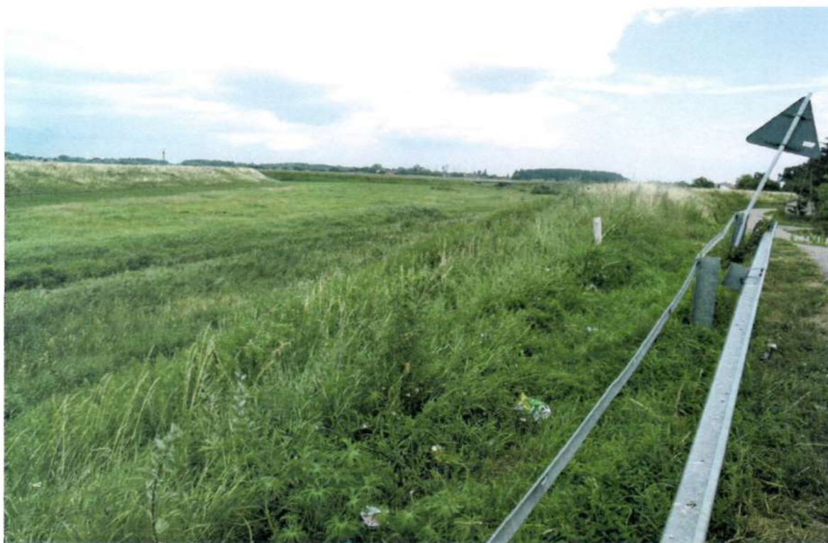
Fot.6. Wał przeciwpowodziowy

Na terenie sołectwa nie ma żadnego obiektu wpisanego do ewidencji zabytków.