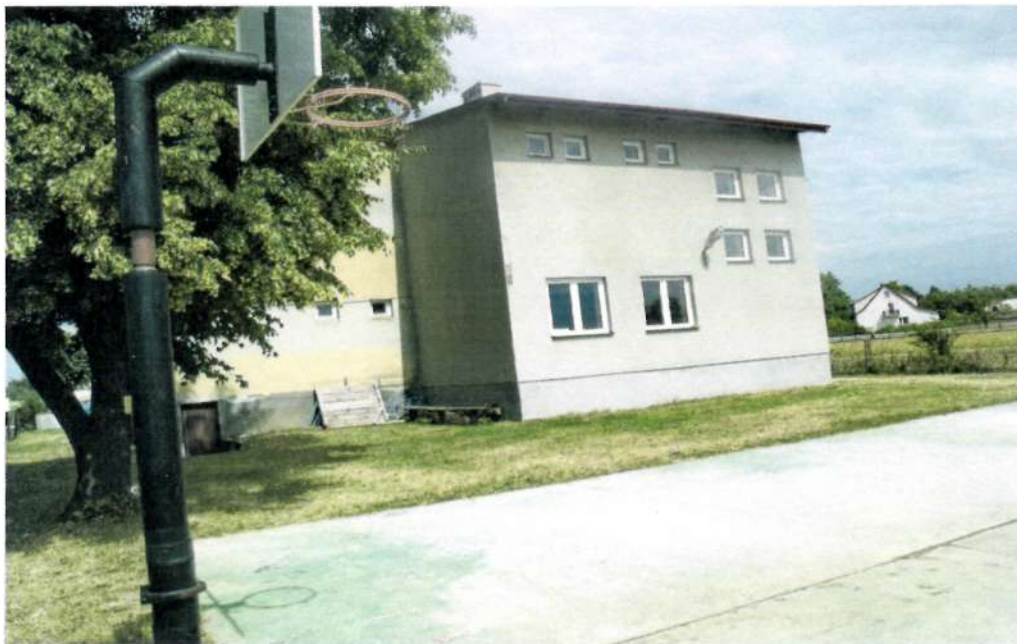
Fot.9. Remiza OSP , widok od strony boiska

W Maśniku znajduje się remiza Ochotniczej Straży Pożarnej. Jest to budynek składający się z dwóch kondygnacji. To miejsce spotkań mieszkańców oraz organizacji działających na terenie wioski. W planach jest zaadaptowanie jednego z pomieszczeń na świetlicę wiejską, która byłaby alternatywą na spędzanie wolnego czasu dla dzieci i młodzieży. Obok remizy jest niewielki plac, który w przyszłości zostanie zmodernizowany poprzez podjęcie takich działań jak budowa zadaszenia i renowacja nawierzchni.