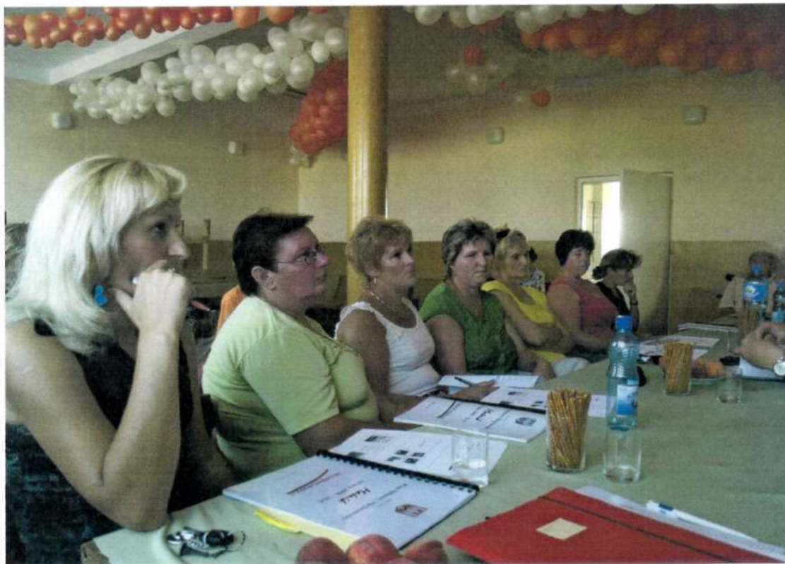
Fot. 4. Spotkanie wiejskie 31.07.2008r.