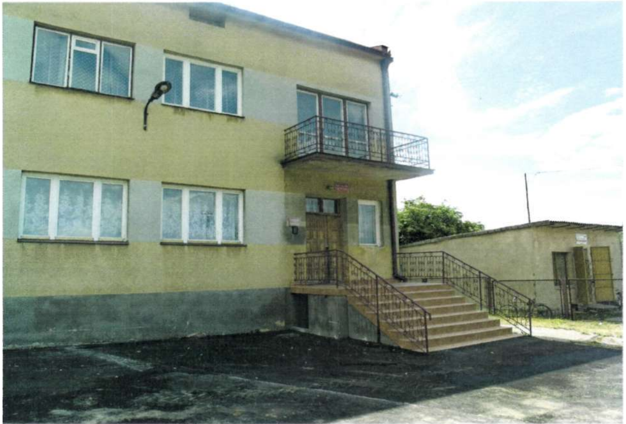
Fot. 7. Remiza OSP Maśnik

Bezpośrednio za remizą znajduje się boisko wielofunkcyjne, wybudowane w czynie społecznym przez mieszkańców Maśnika. Na płycie wydzielone jest boisko do piłki siatkowej, koszykówki oraz do piłki nożnej. Do pełnego zagospodarowania tego kompleksu brakuje zmodernizowanej płyty boiska do piłki nożnej oraz chodnika.