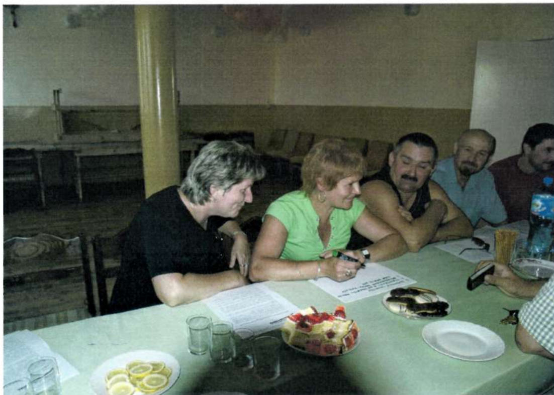
Fot.1. Spotkanie strategiczne 01.07.2008r.