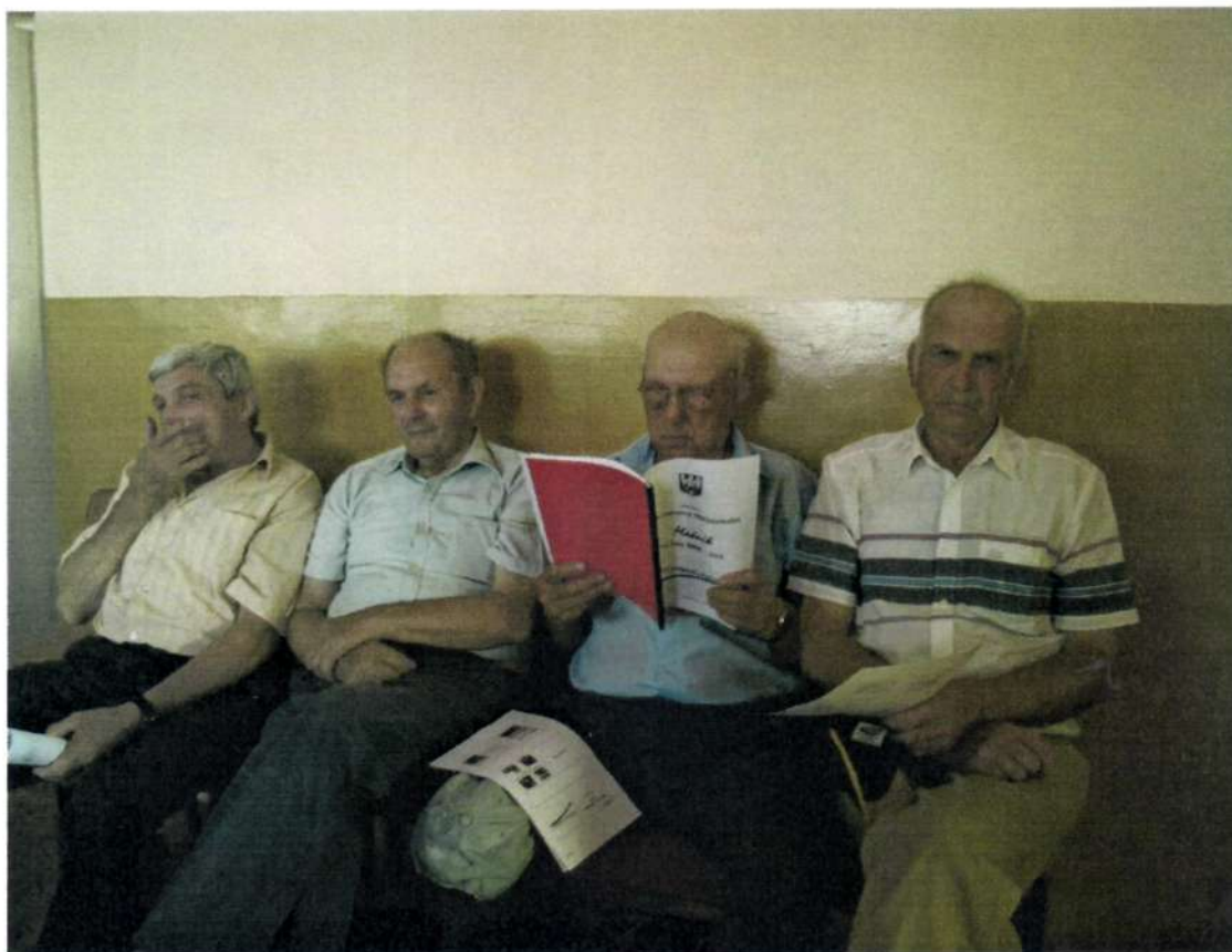
Fot.5. Spotkanie wiejskie 31.07.2008r.