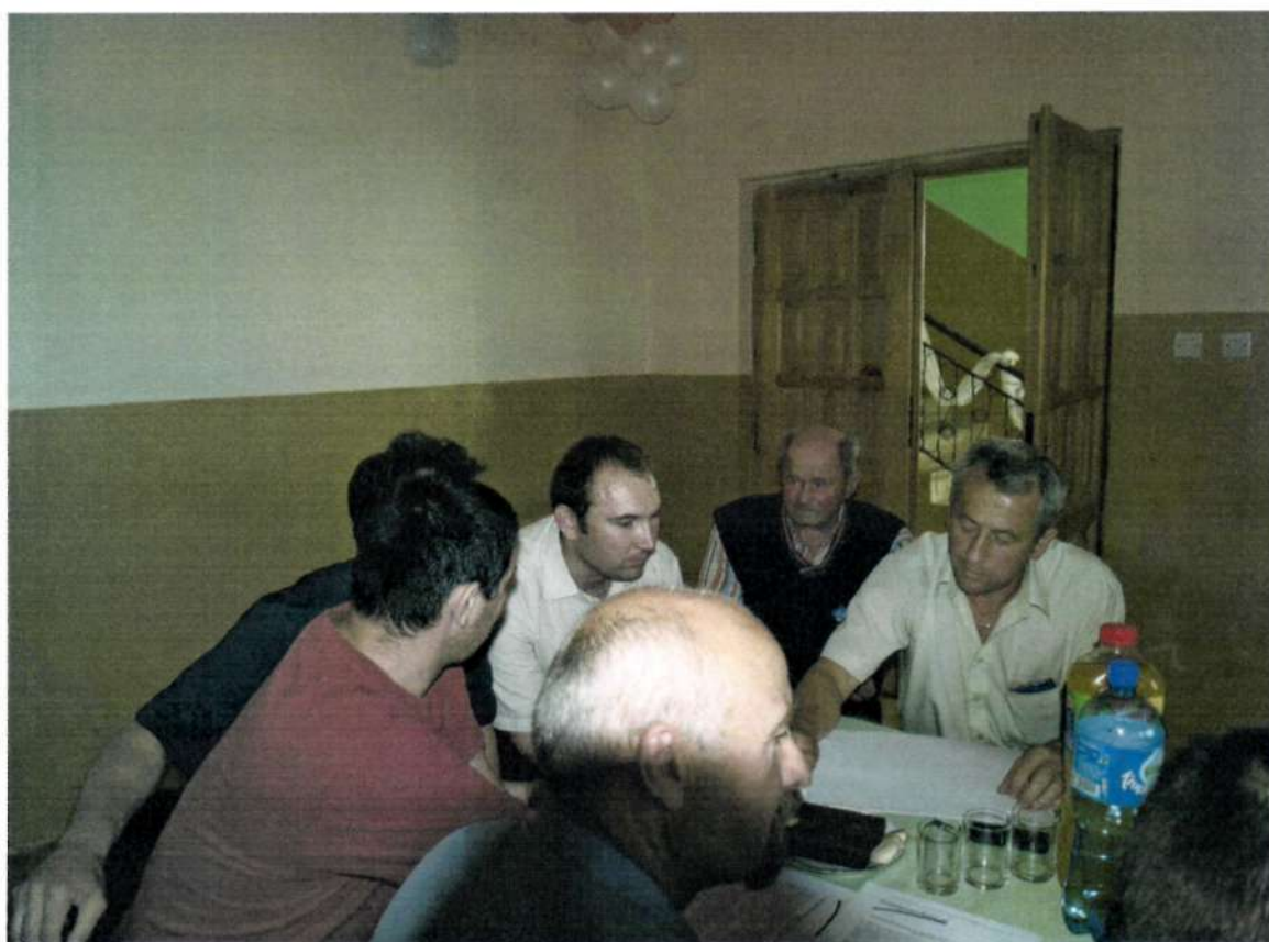
Fot.2. Spotkanie strategiczne 01.07.2008r.