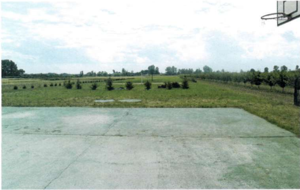
Fot.8. Kompleks boisk sportowych

W Maśniku znajduje się remiza Ochotniczej Straży Pożarnej. Jest to budynek składający się z dwóch kondygnacji. To miejsce spotkań mieszkańców oraz organizacji działających na terenie wioski. W planach jest zaadaptowanie jednego z pomieszczeń na świetlicę wiejską, która byłaby alternatywą na spędzanie wolnego czasu dla dzieci i młodzieży. Obok remizy jest niewielki plac, który w przyszłości zostanie zmodernizowany poprzez podjęcie takich działań jak budowa zadaszenia i renowacja nawierzchni.