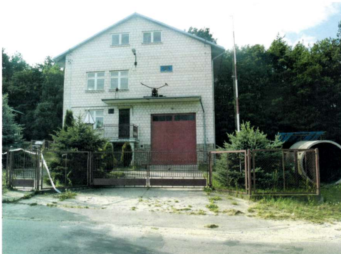
Fot.6. Remiza OSP Tursko Małe

W Tursku znajduje się remiza Ochotniczej Straży Pożarnej. Jest to budynek składający się z dwóch kondygnacji. To miejsce spotkań mieszkańców oraz organizacji działających na terenie wioski. W planach jest zaadaptowanie jednego z pomieszczeń na świetlicę wiejską, która byłaby alternatywą na spędzanie wolnego czasu dla dzieci i młodzieży. Obok remizy jest niewielki plac, który w przyszłości zostanie zmodernizowany poprzez podjęcie takich działań jak budowa zadaszenia i renowacja nawierzchni.