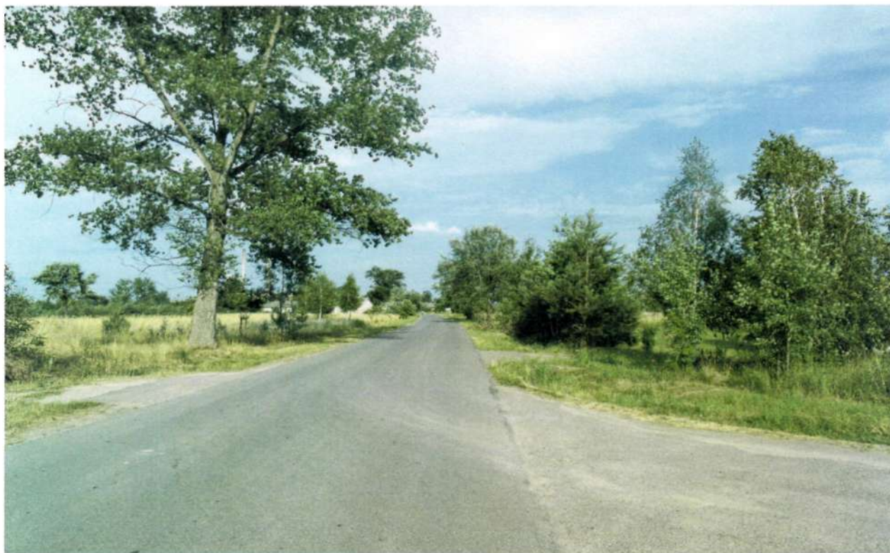
Fot 8. Droga nr XII/2 w kierunku Zamczyska Turskiego

Stan tych dróg nie wymaga na chwilę obecną prac remontowych. Inaczej przedstawia się sytuacja dróg transportu rolniczego, w przypadku których konieczne są działania modernizacyjne, mające na celu utwardzenie nawierzchni.