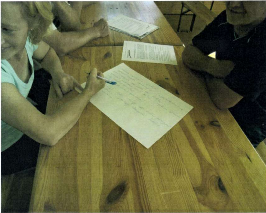
Fot.3. Spotkanie strategiczne 01.07.2008r.