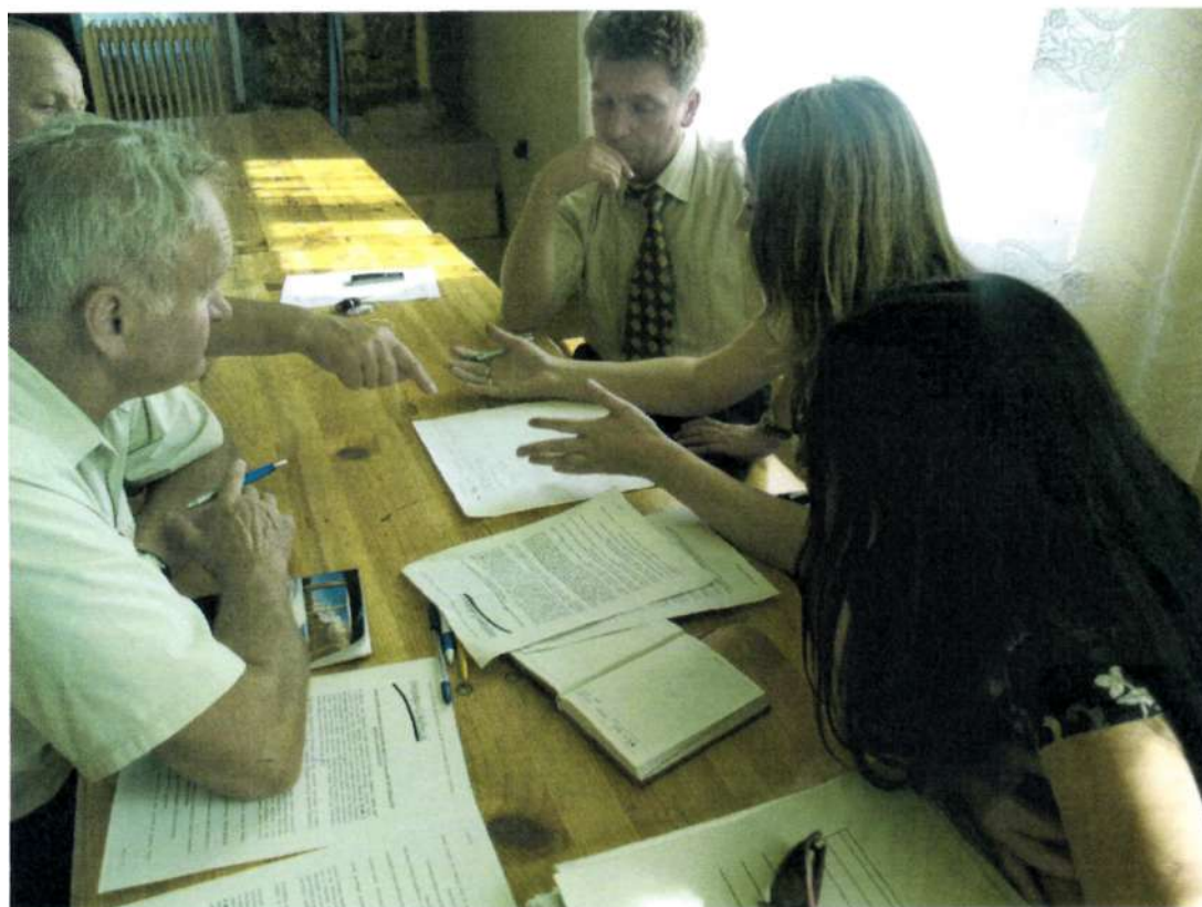
Fot.1. Spotkanie strategiczne 01.07.2008r.