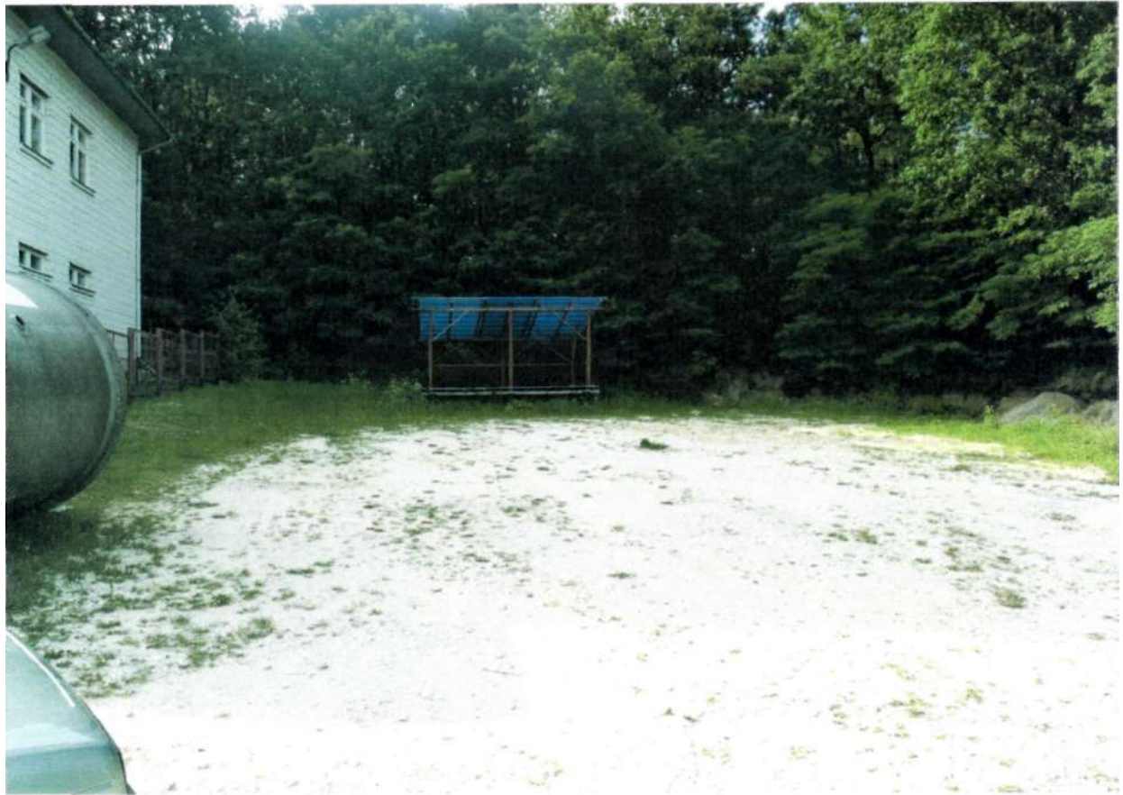
Fot. 7. Plac przy remizie

W krajobraz Turska bez wątpienia wpisuje się zespół budynków Elektrowni Połaniec, która silnie oddziałowuje na funkcjonowanie miejscowości.