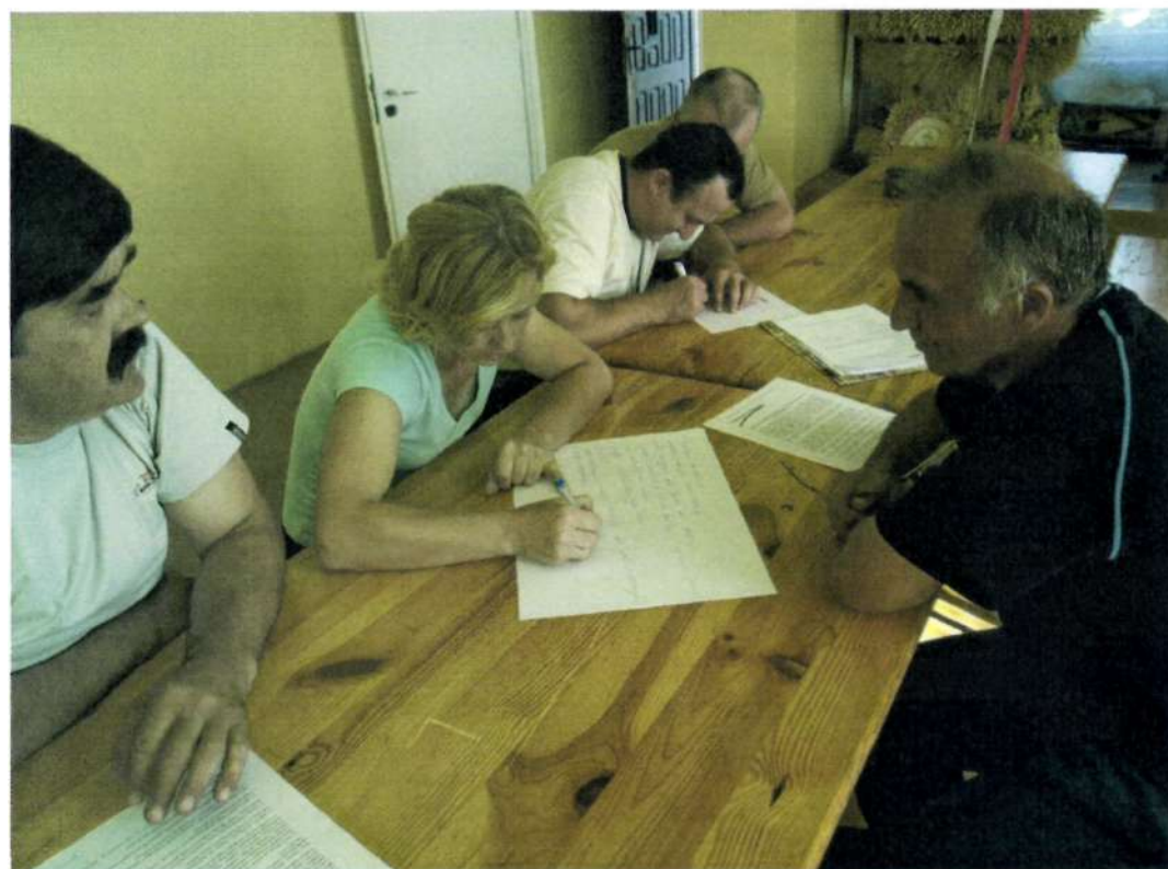
Fot.2. Spotkanie strategiczne 01.07.2008r.