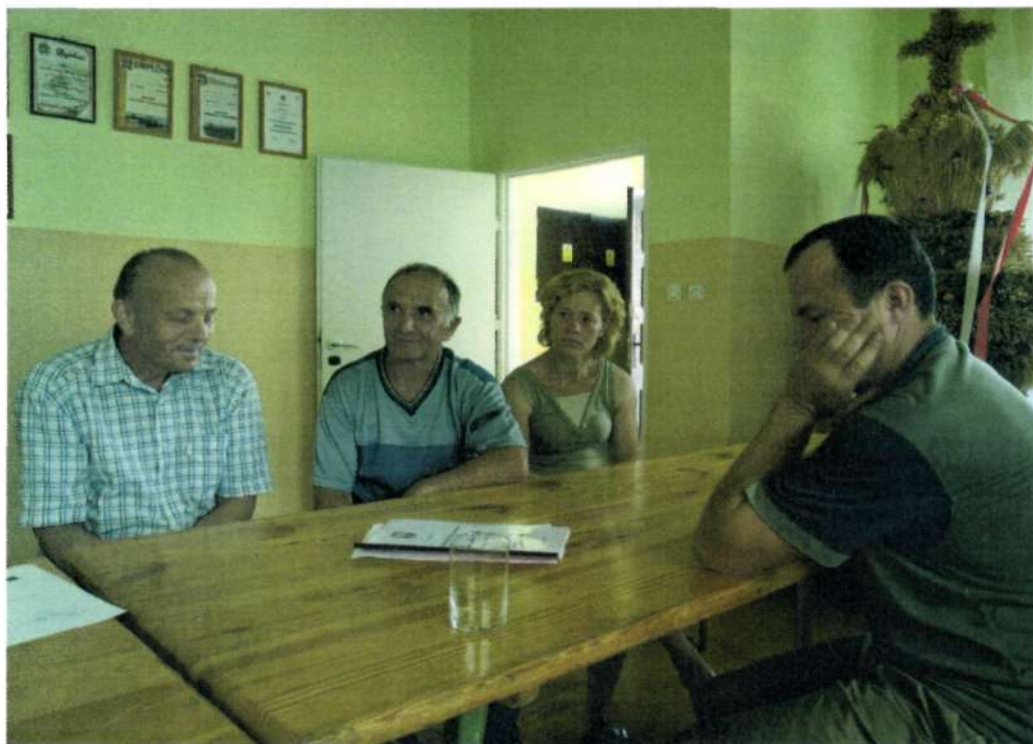
Fot. 4 Spotkanie wiejskie 30.07.2008r.

Projekt był omawiany na zebraniu strategicznym Zespołu Roboczego ds. Planu Odnowy Miejscowości Tursko Małe (01 lipiec 2008 roku) oraz podczas Zebrania Wiejskiego (30 lipca 2008 roku).