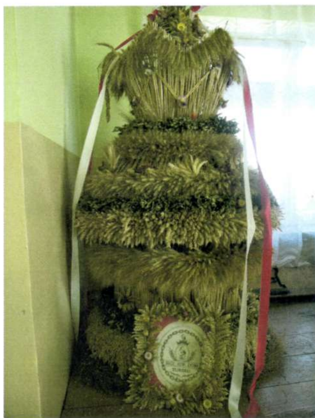
Fot. 9. Wieńce dożynkowe