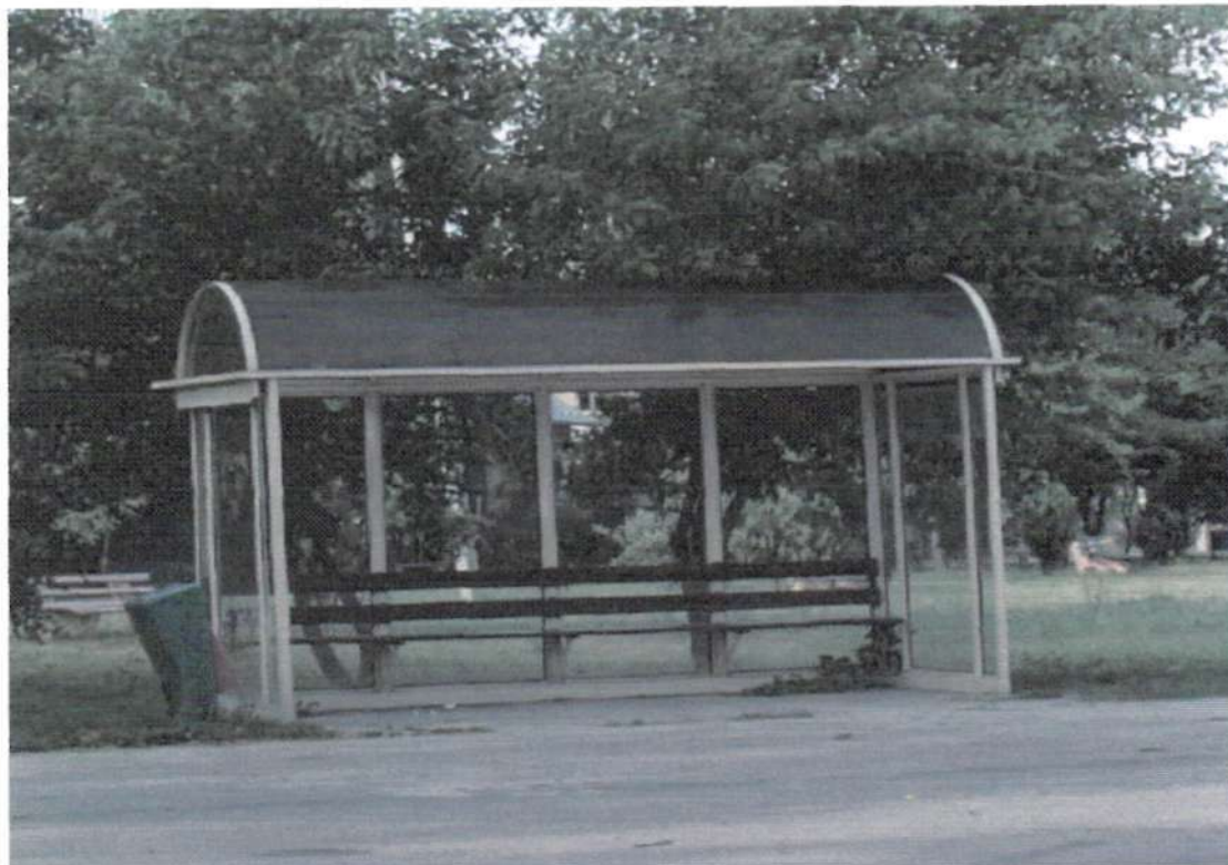
Fot. 4. Przystanek autobusowy w Łęgu, fot. Anna Khuz

Jeden przystanek nie jest wystarczający na potrzeby miejscowości. Mieszkańcy podczas zebrania strategicznego zgłaszali potrzebę wybudowania jeszcze jednego przystanku na drodze prowadzącej do wału. Kolejną realną potrzebą w ramach infrastruktury drogowej jest wybudowanie chodników, co mocno akcentowano na organizowanych spotkaniach.