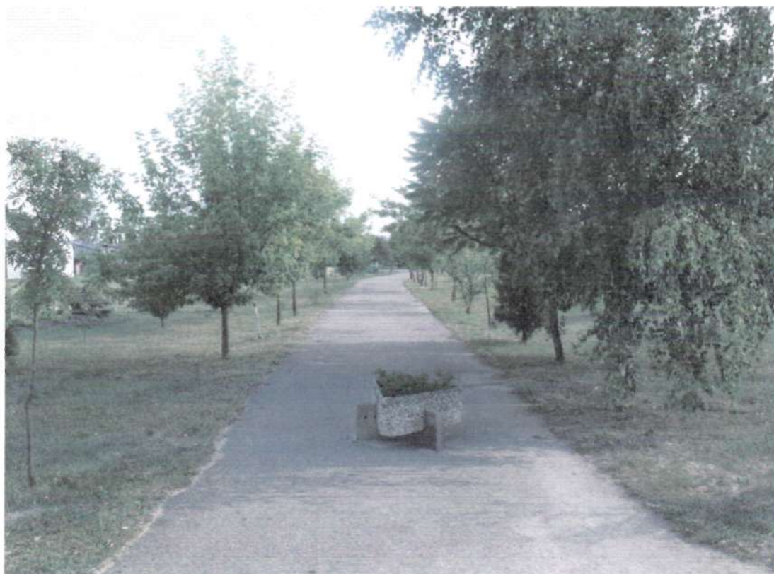
Fot. 3. Alejka