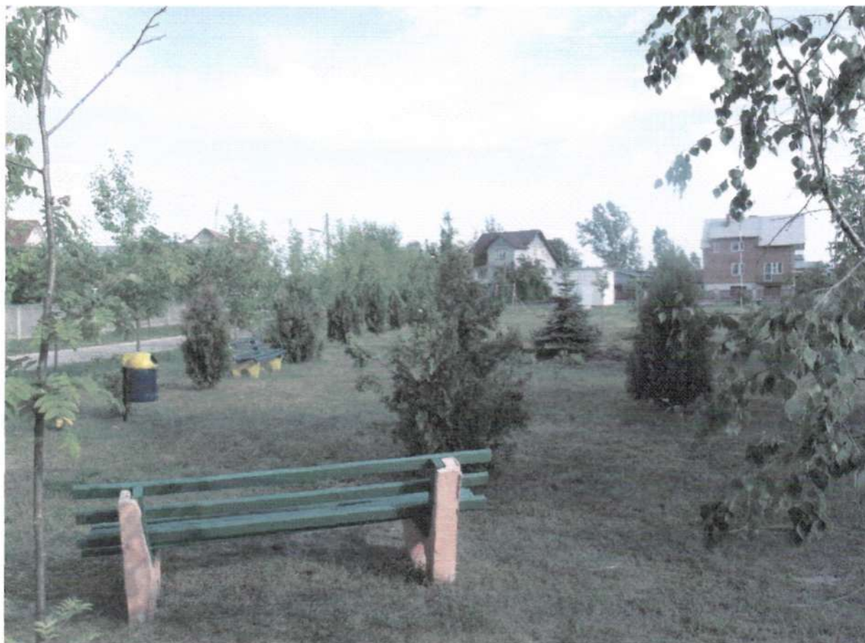
Fot 1. Plac w Centrum Łęgu, fot. Anna Kluz

Największym problemem – na co zwracali uwagę mieszkańcy na zebraniach – jest brak domu wiejskiego i dobrze zagospodarowanego placu w centrum wsi. W planach inwestycyjnych gminy na najbliższe lata uwzględniono m.in. budowę takiego domu, który pełniłby rolę świetlicy. Na dzień dzisiejszy „serce” miejscowości stanowi plac, który został zagospodarowany przez mieszkańców w czynie społecznym. W tym miejscu organizowane są wszystkie imprezy okolicznościowe (np. Dożynki Gminne w 2007 roku)