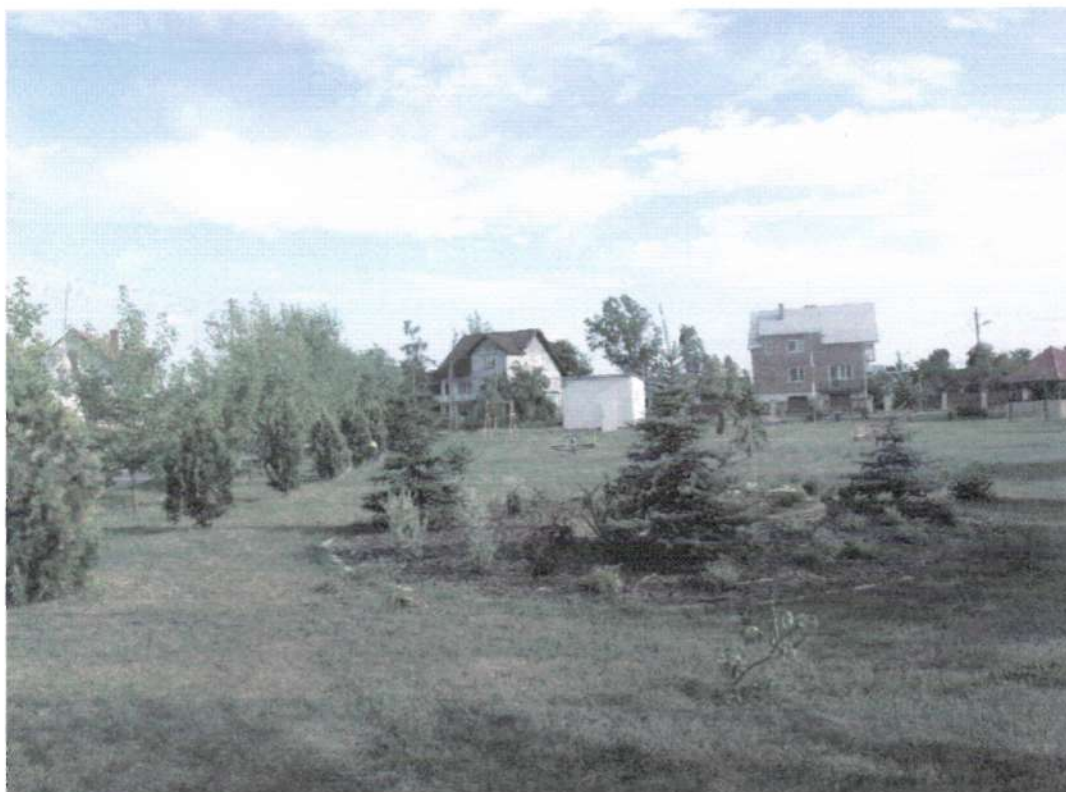
Fot. 2. Centrum Łęgu